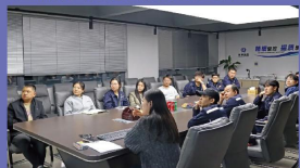
安全板块：将文化融入责任，让安全成为本能

本刊讯（泉舜流控 宋秦）为帮助新同事快速融入泉舜大家庭，深入理解企业文化内涵，4月15日，公司精心组织召开了2026年新员工入职培训会议。本次培训以企业文化为主线，融合安全管理、制度规范等内容，为新员工开启了一场兼具专业深度与文化温度的成长之旅。