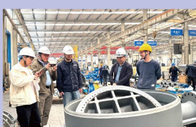
核电装备领域技术要求严苛、品质标准严谨，本次项目合作是中国核电工

流程、技术落地、履约协同等议题深入交流，明确了各环节分工、实施节点及考核标准，为项目全流程高效推进奠定坚实基础。会后，中国核电工程领导一行深入车间，近距离观摩产品生产全流程，深入了解核阀门的生产工艺、制造标准与品质管控体系，对泉舜流控严谨的生产管理、先进的制造设备及严苛的质量把控体系给予了充分认可。