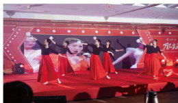
舞蹈《灯火里的中国》 (集团公司)