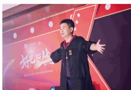
互动魔术视频秀《创造不凡》 (厦漳地产)

饱含深情的歌声，诉说与泉舜之间的不解之缘，唱响那凝聚着团队拼搏奋进精神的激昂旋律。