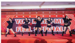
爵士舞《GO HARD》 (东海学院)