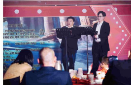
歌曲《魔王》+歌剧《在神殿深处》 (东海学院)

缓缓讲述泉舜这四十年来风雨兼程，恰似一场跨越时空的心灵对话，令人满怀期待，心生向往。