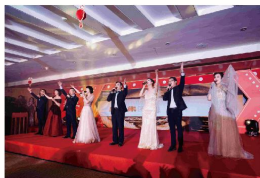
歌曲《我和我的泉舜》 (各公司高管)

饱含深情的歌声，诉说与泉舜之间的不解之缘，唱响那凝聚着团队拼搏奋进精神的激昂旋律。