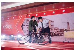
舞台剧《初心不忘》 (东海学院+集团公司)