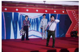
T台年代秀+《野狼DISCO》 (泉舜纸塑+东海学院)

泉舜创业四十周年新春联欢晚会上，多才多艺的泉舜人纷纷登台亮相，用歌声与舞蹈，演绎着对新春的无限热爱与美好祝愿。从深情款款的歌唱，到活力四射的舞蹈，再到回味无穷的舞台剧，每一个节目都凝聚着泉舜人的智慧与才华，展现了团队的凝聚力与创造力。