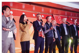
泉舜集团之歌《会拼敢赢》 (集团高管)

用精湛的演唱，展现歌剧的独特魅力，同时也让我们从中汲取力量，继续在传承与创新的道路上前行。