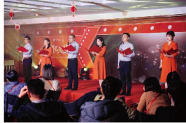
音诗画朗诵《泉舜四十》 (集团公司)

缓缓讲述泉舜这四十年来风雨兼程，恰似一场跨越时空的心灵对话，令人满怀期待，心生向往。