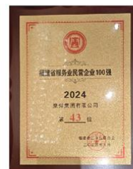
9月19日 泉舜集团再登福建省服 务业民营企业百强榜单