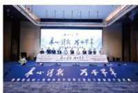
7月29日 洛阳泉舜万豪酒店开业 庆典盛大举行