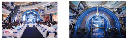
4月27日 洛阳泉舜购物中心十周年启幕仪式圆满举行