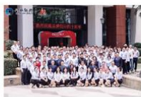
5月18日 泉舜创业四十周年庆祝 活动圆满举办