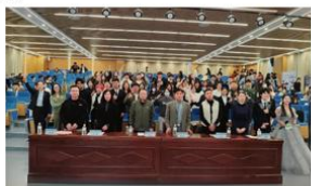
12月26日，厦门东海学院五号楼报告厅内，首届策划大赛圆满落幕。此次

本刊讯（东海学院 校办公室）随着灯光渐亮，舞台中央，一支支充满活力的队伍自信满满地站定，他们的眼神中闪烁着对创意的热爱与对实践的渴望。“大家好，我们是XX队，今天很荣幸由我们来揭开我们精心策划的创意方案的面纱，带大家走进一个充满无限可能的商业世界。”随着主讲学生的话语落下，厦门东海学院首届策划大赛的决赛现场瞬间被一股浓厚的创意氛围所包围。