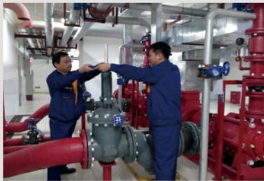
第二阶段：整改实施阶段

优”热情，深化整改工作，提升细节服务，对服务的标准严格要求不放松，将创优作为常态化服务标准，坚持实施。