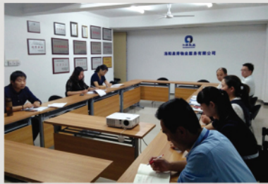
第一阶段：创优总动员

2017年为洛阳泉舜物业的“服务提升年”，泉舜物业人每时每刻都在想着如何提升服务品质。在公司各级领导的支持和关怀下，都在努力向着高服务品质方向发展。自参评“省级物业服务公共物业示范项目”以来，公司领导挂帅，与物业管理处、各职能部门组成创优工作小组，加强对“创优”工作的协调与支持力度，确保“创优”工作必要的人力、物力保障。